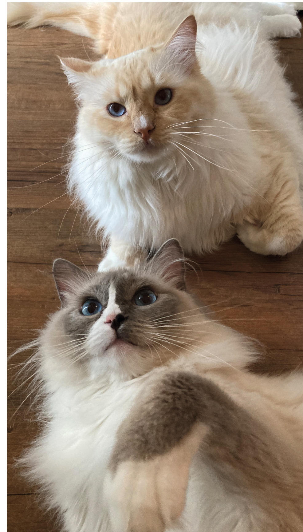
Kijk ook bij langharige katten eerst of ze hun eigen vacht kunnen verzorgen.

Heb je een langharige kat? Hier geldt hetzelfde principe. Vanaf het moment dat de kattenvacht volledig volgroeid is, dit is bij een langharige kat tussen één- en vierjarige leeftijd, kan je observeren of de kat zijn vacht zelf kan onderhouden. Dit doe je door in de lente en zomer dagelijks en tijdens de rest van het jaar wekelijks, alle plaatsen te controleren met jouw vingers op beginnende knopen of klitten. Plaatsen die je zeker goed moet nakijken zijn de borst, de oksels en liezen, achter de oren, de buik en de achterkant. Vanaf het moment dat de pels nat wordt, of er iets in blijft kleven zoals stoelgang, neemt de kans op een klit toe.