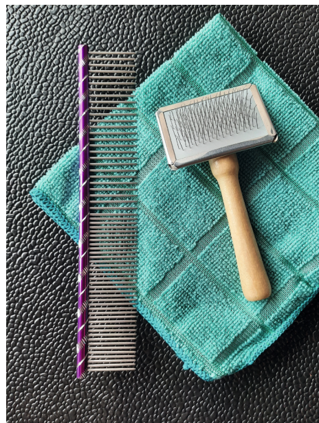
Grove kam, mini slickerborstel en microvezeldoek.

Alle scherpe voorwerpen gebruik je beter niet. Een schaar is helemaal uit den boze. Regelmatig proberen eigenaren klitten weg te knippen. Omdat de huid van een kat zo flexibel is, is er een grote kans dat je in de huid knipt, met een dierenartsbezoek en een getraumatiseerde kat tot gevolg.